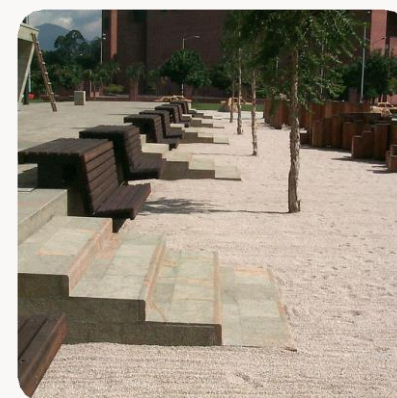
Parque de los pies descalzos